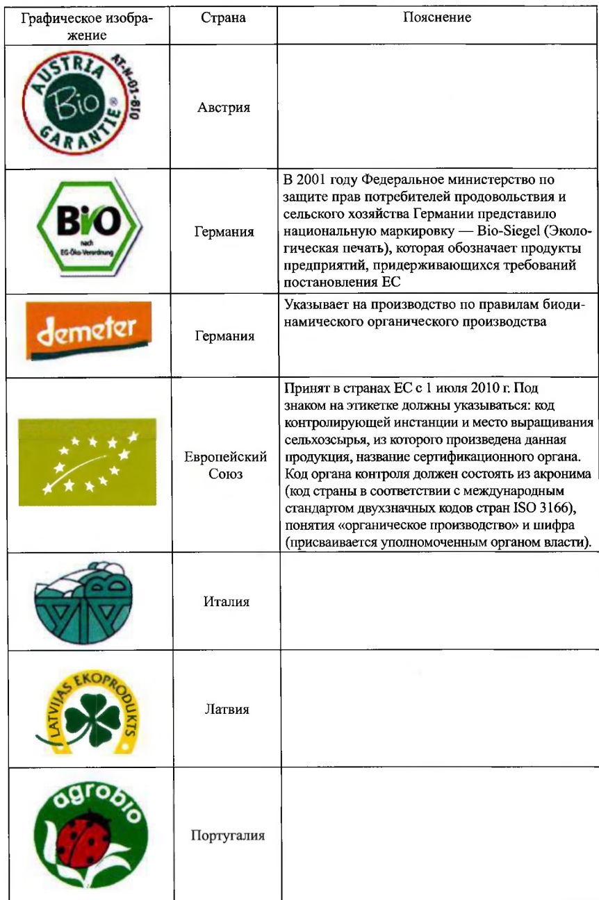
Таблица 10 — Маркировка органической продукции в странах мира