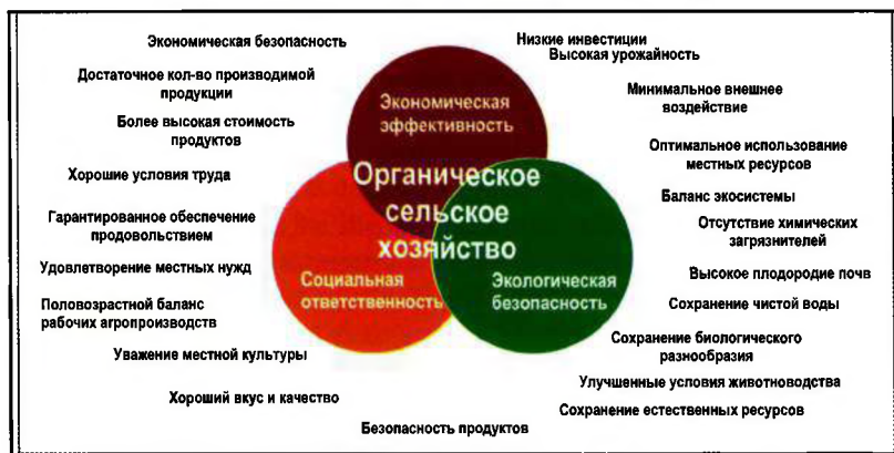
Рисунок 1 — Основные цели биоорганического сельского хозяйства.

Согласно данным Международной федерации движений за органическое сельское хозяйство ( IFOAM ), органическое сельское хозяйство должно отвечать трем целям: экономической эффективности, экологической безопасности и социальной ответственности (рис. 1).